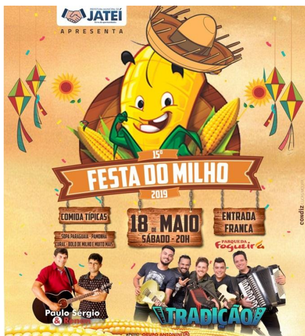
Cartaz da Festa do Milho 2019

Festa do Milho: (sempre na 2ª quinzena de maio)