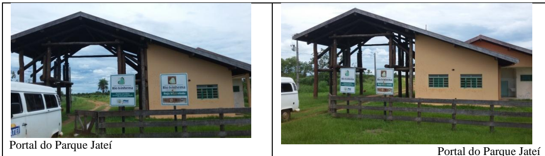
Portal do Parque Jateí