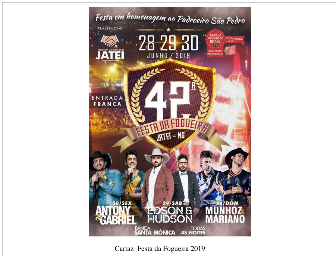
Cartaz Festa da Fogueira 2019