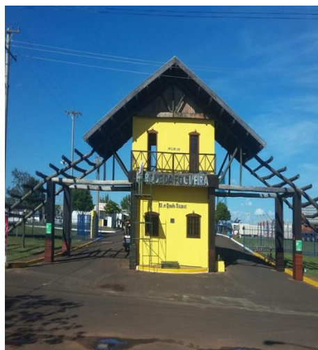
Entrada do Parque da Fogueira